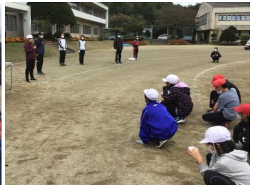
〈実行委員のあいさつ〉