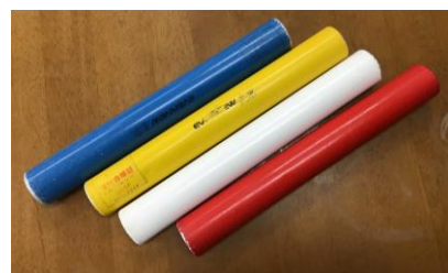
(1・2・3年生の部 リングバトン、4・5・6年生の部 バトン)