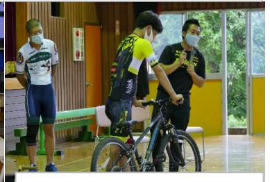
・那須ブラーゼンによる自転車の安全な乗り方