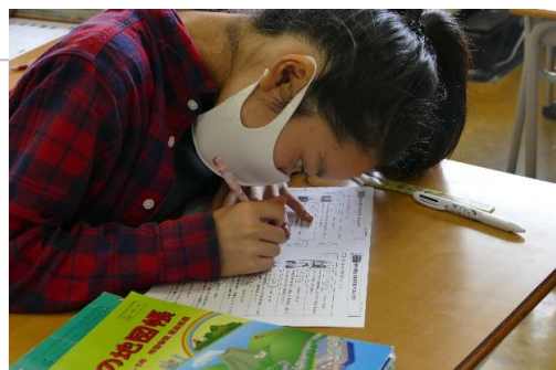
・学習の様子(6年生)【写真 上】 ・読書の様子(5年生)【写真 下】

飛ばし読みとは、文を冒頭から丁寧に追っていくのではなく、一部の単語だけを拾いながら読んでいく方法。重要なキーワードを適当に拾っていけば効率よく読書できますが、読解力の低い人は、不適切な飛ばし読みを