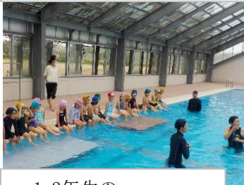
・1・2年生の水泳授業

水泳教室、防災教室、環境教室、交通安全教室など外部から講師を招き、より専門的な知識を得ながらの授業を行いました。子どもたちはどの授業も真剣に受けていました。