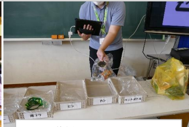
・町職員によるゴミの分別の仕方