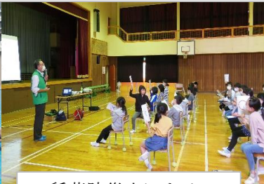
・稲葉防災士による雷の被害防止